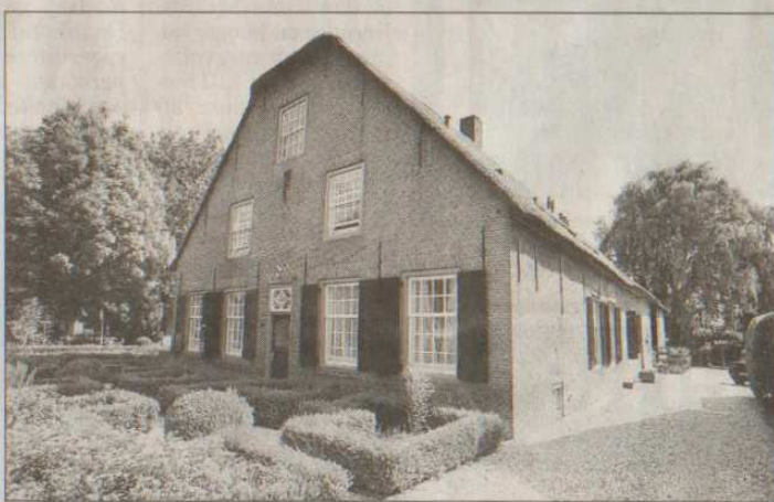
■ De onderkomens worden zorgvuldig uitgezocht. Oude panden en boerderijen, zoals deze in Andel, worden prachtig gerestaureerd.

advies gegeven over onze werkwijze", zegt een trotse Van Putten.